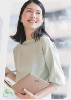
コワーキング スペース