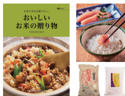
おいしいお米の贈り物