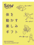
体を動かす楽しみ体験ギフト